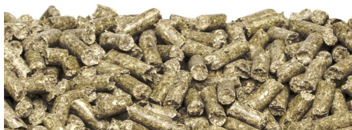
SAFE ® R03T-25 4,5mm