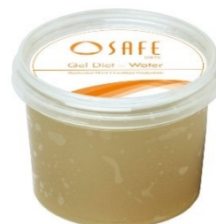
SAFE ® gel diet water

Pour les périodes de stress: animaux affaiblis, postopératoire, transport, élevage, ... A utiliser dans le cadre de protocoles expérimentaux. Peut être distribué en complément de l'eau.